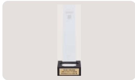
日経・FTグローバル特別賞 トロフィー