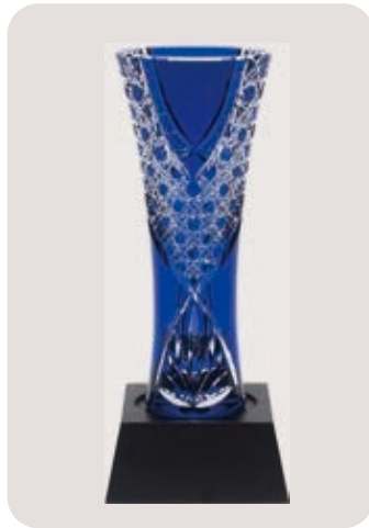
江戸切子トロフィー