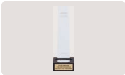
日経広告賞 70 回記念特別賞 トロフィー