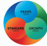
Power of Tokyo Market