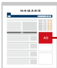
日経电子版各種誘導 (バナー・テキストなど)

ホワイトペーパーダウンロード形式も可能です。 ホワイトペーパーをご提供いただき、電子版でその紹介ページを作成します。日経IDログインし、資料をダウンロードすることも可能です。